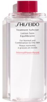
SHISEIDO スキンケアトリートメントソフナー (レフィル) SHISEIDO TREATMENT SOFTENER REFILL

SHISEIDO TREATMENT SOFTENER REFILL (Container)