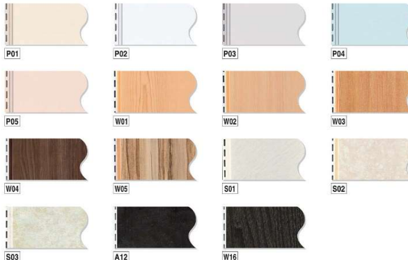
カラーバリエーション