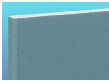
タイガーR100・タイプZ-WR