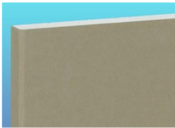
タイガーR100・タイプZ