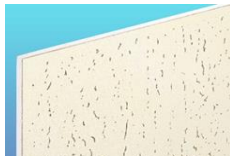
タイガーマーブルトーン・ライト タイガー不燃マーブルトーン・ライト