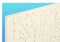
タイガーハイクリンマーブルトーン・ライト タイガー不燃ハイクリンマーブルトーン・ライト