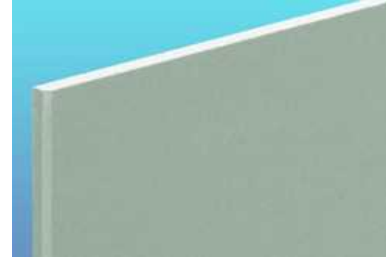
タイガー不燃防水ボード