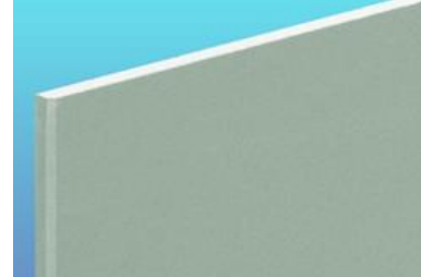
タイガー不燃防水ボード