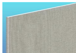
エンボスタイガーボード