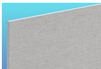
タイガーハイクリンボードAce・ アートタイプ