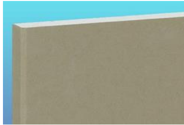
タイガーボード・タイプZ

強化せっこうボード (GB-F) Reinforced Gypsum Board (GB-F)