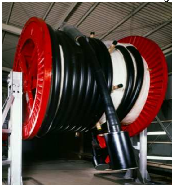
被覆平行線ケーブル (NEW PWS)