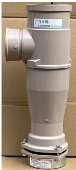
(振動絶縁材装着前)

Fitting for Single Stack Drainage System with Cast Iron