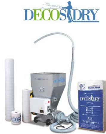
最終製品と施工機器(イメージ)